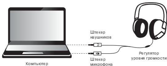
Рис. 1. Схема подключения